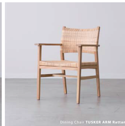
Dining Chair TUSKER ARM Rattan