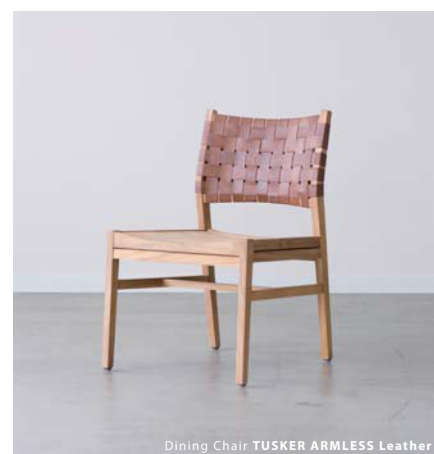
Dining Chair TUSKER ARMLESS Leather

軽くて快適な座り心地のファブリック。 通気性とクッション性に優れたラタン。 使い込むほどに味がでてくるアニリン革。