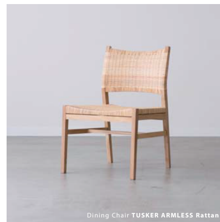
Dining Chair TUSKER ARMLESS Rattan