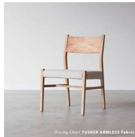
Dining Chair TUSKER ARMLESS Fabric