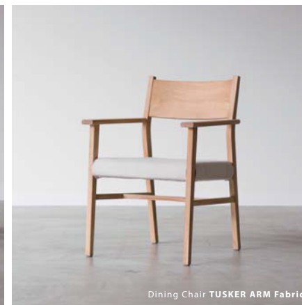
Dining Chair TUSKER ARM Fabric