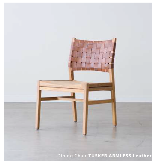
Dining Chair TUSKER ARMLESS Leather

軽くて快適な座り心地のファブリック。 通気性とクッション性に優れたラタン。 使い込むほどに味がでてくるアニリン革。