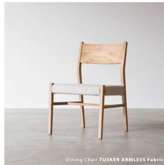
Dining Chair TUSKER ARMLESS Fabric