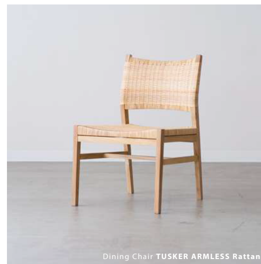
Dining Chair TUSKER ARMLESS Rattan