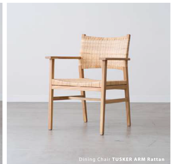
Dining Chair TUSKER ARM Rattan