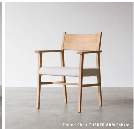
Dining Chair TUSKER ARM Fabric